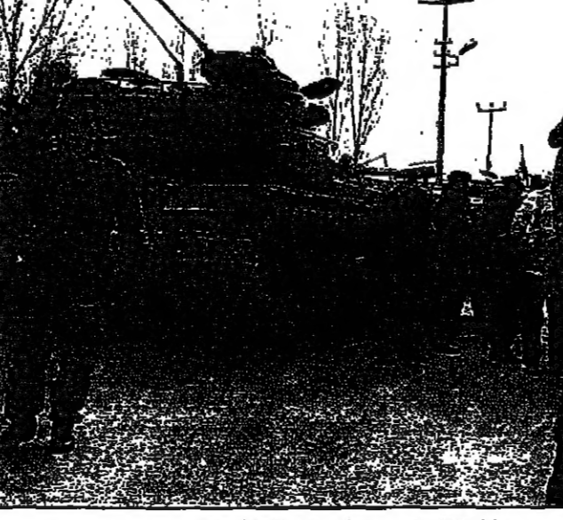
ديانات تنتشر في حي اسلامي قرب انقرة

وجه الجيش التركي الثلاثاء تحذيراً صريحاً الى المسلمين في أي تحريف مناهض للمعالم الدينية. ان قائد حرس اربيل اية عسكرية باجتياز منطقة يؤولي رئيس بلدية اسلامي ادارتها واقامت فيها الجمعة امسية حول القدس، اثار رد فعل عنيف في اوساط التركي اللويدية العلمانية.